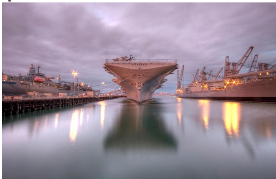
Anonymní snímek z neznámého doku.